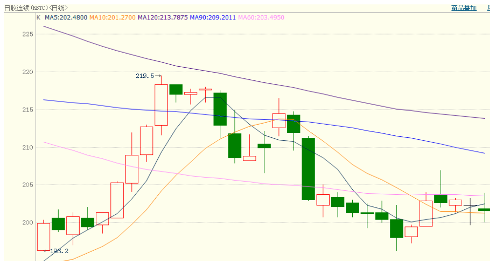
图 2、日胶连续 7 月 23 日行情走势