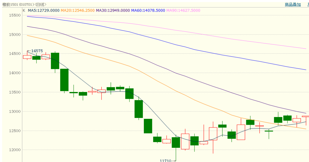
图 1、沪胶 1501 10 月 22 日行情走势