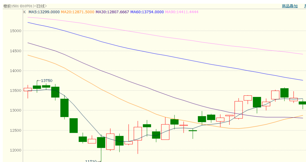
图 1、沪胶 1501 11 月 3 日行情走势