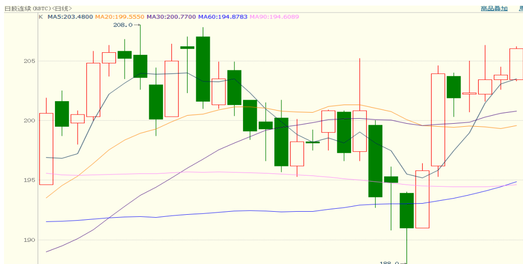
图 2、日胶连续 12 月 22 日行情走势