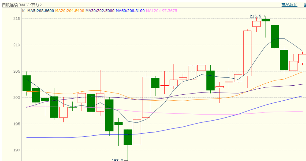
图 2、日胶连续 1 月 12 日行情走势