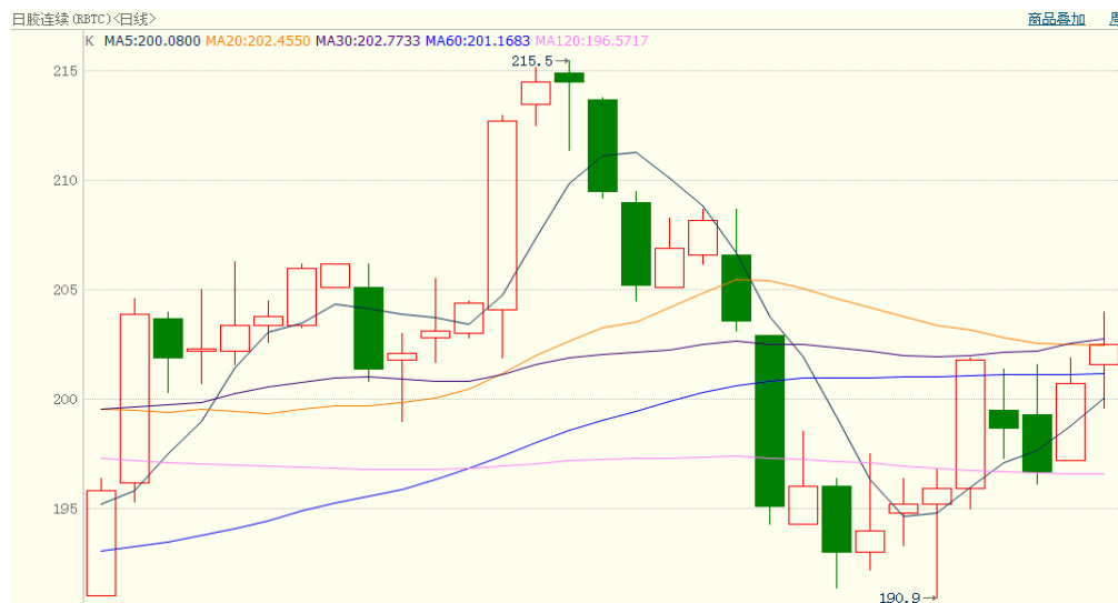
图 2、日胶连续 1月 28 日行情走势